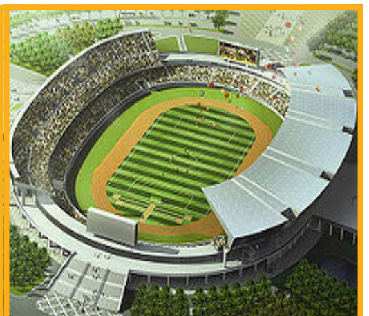
Das neu erbaute Stadion in Maputo