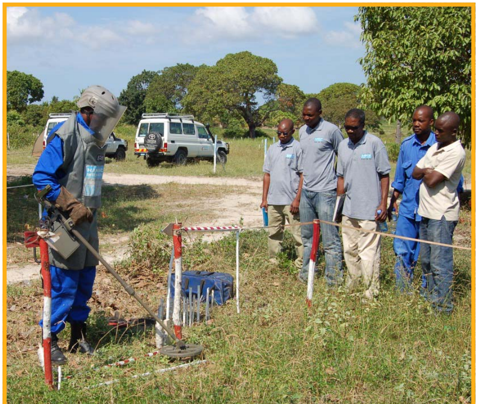
Ein Minenräumer zeigt den mosambikanischen Kollegen von Handicap International, wie mühsam die Entminung ist.

Das System zur Minenräumung, das von Handicap International genutzt wird, besteht aus manuellen Entminern, Metalldetektoren und Minenspürhunden.