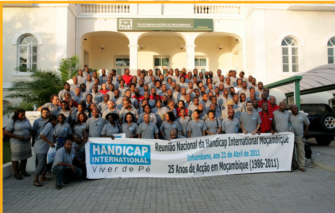
Das Team von Handicap International vor Ort in Mosambik.