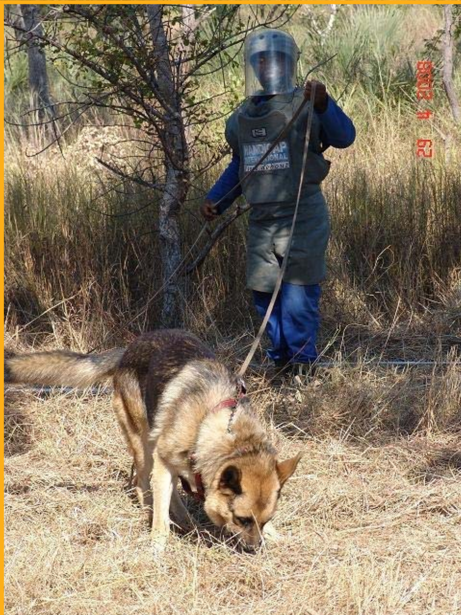
Ein Minenspürhund im Einsatz

Bis Mitte 2011 wurden zwölf der insgesamt 24 Bereiche in den beiden Provinzen Sofala und Inhambane, die unter der Verantwortung von Handicap International stehen, geräumt und wieder zur Nutzung für die Dorfgemeinschaften freigegeben werden. Die ursprüngliche Anzahl von 355 als gefährlich eingestuft Gebieten konnte auf 144 reduziert werden und von 6,2 Millionen zu entminenden Quadratmetern wurden bereits rund 3,7 Millionen Quadratmeter geräumt. Damit verbleiben zwölf zu entminende Bereiche.