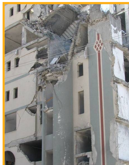
Zerstörtes Haus im Gazastreifen Trotz massiver Zerstörung wollen viele in ihre Heimat zurück.

Der palästinensischen Gemeinde im Libanon ist es untersagt, Eigentum zu besitzen. Sie ist staatenlos, darf nur eingeschränkt arbeiten und ist in physischen und rechtlichen Mauern eingeschlossen. Paradoxerweise ist das das einzige Anzeichen dafür,