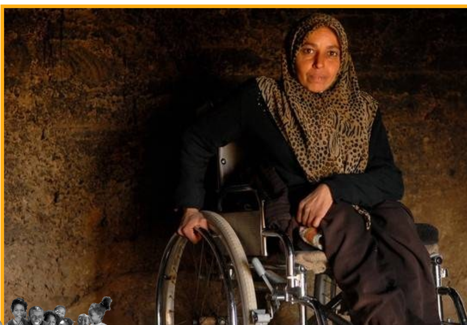
Diese Rollstuhlfahrerin ist durch die schlechten Straßenverhältnisse ans Haus gebunden.

Und dann sind da noch all die anderen, deren Körper fast gar nicht mehr funktioniert, für die der Zugang zu medizinischer Versorgung jeden Tag einen Kampf darstellt, in einem Umfeld, in dem man als Rollstuhlfahrer überhaupt nirgends hinkommt und dazu verurteilt ist,