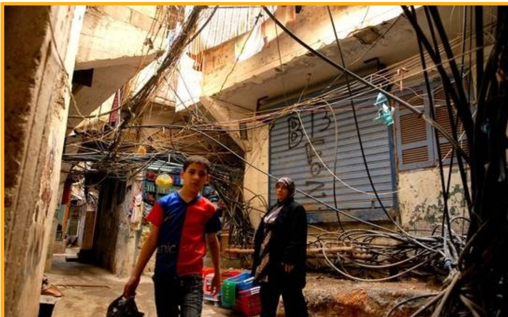
Ein Gewirr illegal gelegter Stromleitungen durchzieht die Gassen.

Weitere Berichte von Xavier Bourgois finden Sie in seinem Blog: http://xavier-bourgois.blog.lemonde.fr