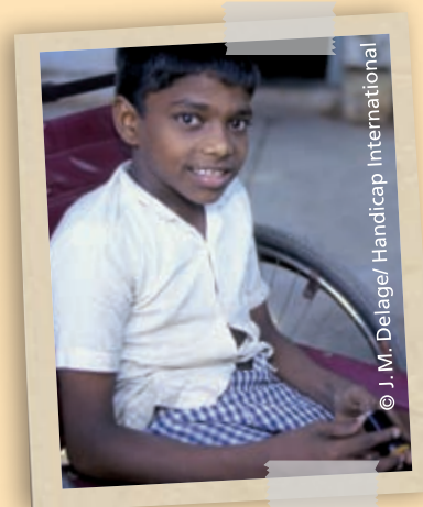
Querschnittgelähmter Junge aus Indien