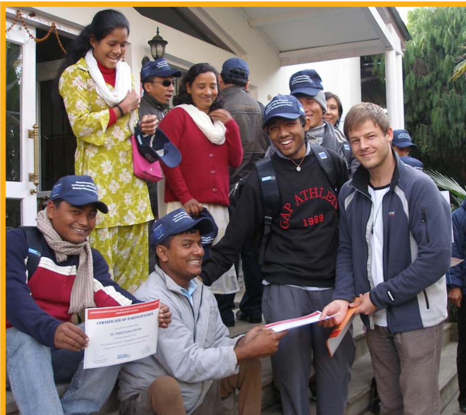
Teilnehmer an einer Fortbildung zur Integration von Menschen mit Behinderung in Nothilfe-einsätzen