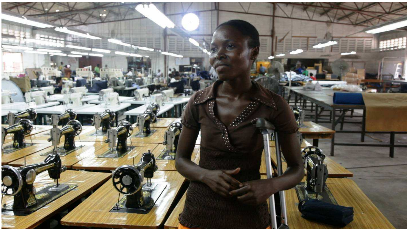
Rose-Mika wurde durch das Erdbeben verletzt und macht nun eine Schneiderausbildung bei Indepco, einer Firma mit einem Geschäftsführer, der erkannt hat, wie wichtig die Inklusion von Menschen mit Behinderung ist.

Naturkatastrophen bringen oft die Ungleichheiten einer Gesellschaft zum Vorschein. Deswegen legt Handicap International so großen Wert darauf, dass Menschen mit Behinderung bei humanitären Interventionen und Nothilfe-Aktivitäten berücksichtigt werden, sowie auch später in der Politik des Landes (in den Bereichen Bildung, Gesundheit, Ökonomie...).