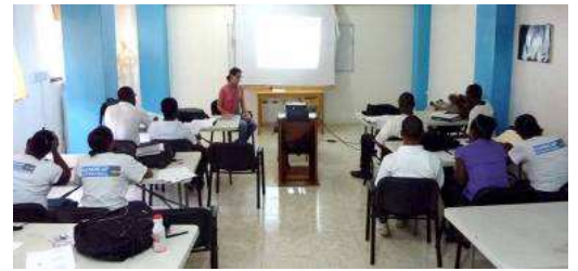
© Handicap International – Unterricht in Haiti

Das Ziel von Handicap International ist es, eine langfristige Versorgung mit Orthopädietechnik und Rehabilitation in Haiti aufbauen. Dafür werden einheimische Fachkräfte ausgebildet, um die Nachhaltigkeit der Projekte sicherzustellen. Aktuell arbeiten unsere Spezialisten mit haitianischem Personal und der Organisation Healing Hands for Haiti zusammen, um ein Ausbildungsprogramm zu erarbeiten, das zu einem Diplom führt. So können Kompetenzen vermittelt werden und die langfristige Wirkung unserer Arbeit sichergestellt werden.