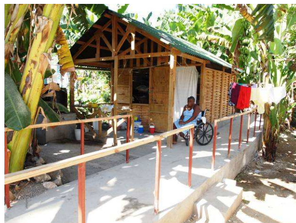
Haus mit Zugangsrampe

Die Unterkünfte sind dafür konzipiert, drei Jahre zu halten, doch bei guter Pflege können sie durchaus auch länger bewohnt werden. Sie bestehen aus einem Holzgerüst und Dächern, die durch ihre Form nur schwer vom Wind erfasst werden können. Der