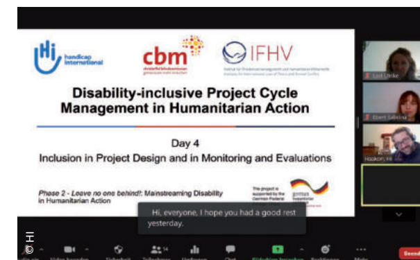
Vierter Tag des virtuellen, inklusiven und zugänglichen regionalen Trainings für die Region Ostafrika zum Thema inklusives Projektmanagement in der humanitären Hilfe

Das Projekt „Phase 2 – Leave no one behind! Mainstreaming von Behinderung in der humanitären Hilfe“ wird seit 2018 von Handicap International gemeinsam mit der Christoffel Blindenmission und der Ruhr-Universität Bochum implementiert. In 2020 passten wir unsere Aktivitäten auf ein digitales Format an. Wir lancierten unsere barrierefreie Projektwebsite und führten unsere Trainings digital, zugänglich und interaktiv durch. Die Erkenntnisse teilten wir mit anderen Akteuren und platzierten das Thema Behinderung auf ihren Veranstaltungen. Wir trugen z. B. erheblich zur barrierearmen Gestaltung des ersten digitalen Humanitären Kongresses in Berlin bei und erreichten ca. 700 Teilnehmende mit unserer Botschaft, dass die Inklusion von Menschen mit Behinderung alle betrifft und allen zugute kommt.