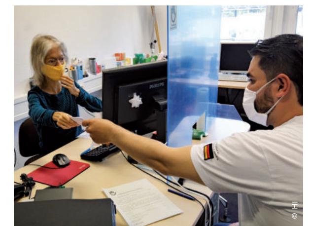
Persönliche Beratungen bei ComIn konnten in 2020 nur begrenzt stattfinden.