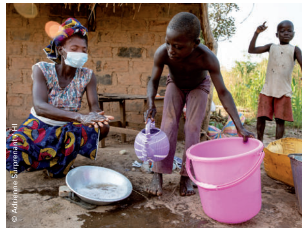
Gemeinsam mit Partnerorganisationen klärten wir Menschen in der Zentralafrikanischen Republik zu Gesundheitsmaßnahmen auf und verteilten Hygienekits an 7.500 Haushalte.