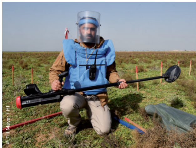
Viele Regionen sind auch nach Ende eines Konflikts mit explosiven Kriegsresten verseucht. Unsere HI-Entminer*innen machen das Land wieder für die Bevölkerung nutzbar.

Ich bin den HI-Teams sehr dankbar, die so vielen Verletzten so toll geholfen haben. Ich bin zuversichtlich, dass ich mit ihrer Unterstützung diese schwierige Zeit überwinden kann.