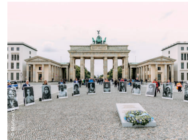
Bundestagsabgeordnete verschiedener Parteien unterstützten unsere Aktion gegen die Bombardierung von Zivilist*innen am Brandenburger Tor.

2,2 Millionen Menschen haben wir in der Corona-Krise unterstützt. 802.000 Masken wurden seit Beginn der Krise in 46 Ländern verteilt.