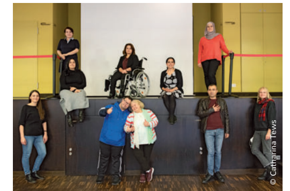
Erstes persönliches Treffen der Selbstvertreter*innen in Berlin

Dem Team von Crossroads ist es trotz der Corona-Pandemie gelungen, seine Position als zentraler Fachakteur an der Schnittstelle Flucht und Behinderung zu konsolidieren und seine Aktivitäten zu Netzwerkbildung, Interessenvertretung, Sensibilisierung, Fortbildung und Beratung weiter auszubauen. Bundesweit sind die vielfältigen Arbeitsbeziehungen zu Wohlfahrtsverbänden und NGOs aus den Bereichen Flüchtlings- und Behindertenhilfe vertieft worden. Mit weiteren renommierten Akteuren (z. B. UNHCR, Generalsekretariat des Deutschen Roten Kreuzes) sind neue Kooperationen entstanden. Das partizipative Teilprojekt „Empowerment Now – Aufbau von Strukturen der Selbstvertretung von Geflüchteten mit Behinderung“ wurde begonnen. Obwohl der Zugang zur Zielgruppe pandemiebedingt eingeschränkt war, konnte eine Gruppe von zwölf engagierten und hoch motivierten Selbstvertreter*innen aus dem gesamten Bundesgebiet etabliert werden.