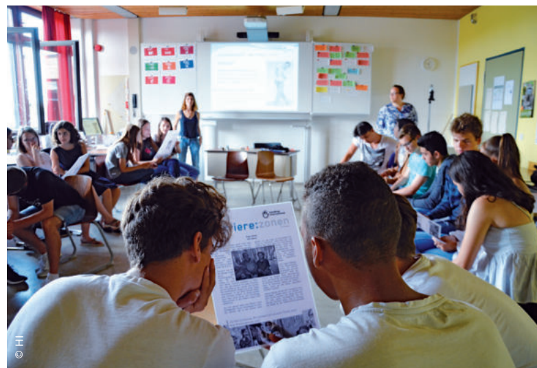
Eindrücke einer Schulveranstaltung zum Thema „Behinderung“ aus dem Jahr 2018

Unser pädagogisches Angebot für Schulen hat viele Schüler*innen erreicht. Nach Ausbruch der Pandemie haben wir zusätzlich Online-Alternativen mit eigens gedrehten Filmen, neu gestalteten Spielen und Präsentationen erstellt. Diese Materialien können von Schüler*innen selbst bearbeitet oder in einer Online-Schulstunde von einer unserer Fachkräfte eingesetzt werden. Es soll auch nach der Pandemie unsere Präsenzveranstaltungen sinnvoll ergänzen.